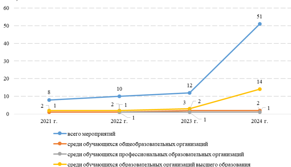
Рисунок 2 – Динамика количества физкультурных мероприятий и массовых спортивных мероприятий по серфингу, проведенных региональными спортивными федерациями, среди различных возрастных групп населения

Расширение перечня мест проведения физкультурных и спортивных массовых мероприятий говорит о постепенной популяризации серфинга среди различных возрастных групп населения России. По данным Российской Федерации серфинга и на основании данных, собранных агрегаторами информации (АО «Мой Спорт» и др.) о региональных физкультурных и спортивных мероприятиях, с 2022 по 2024 гг. наблюдается рост количества мероприятий, проводимых региональными спортивными федерациями (рисунок 2).